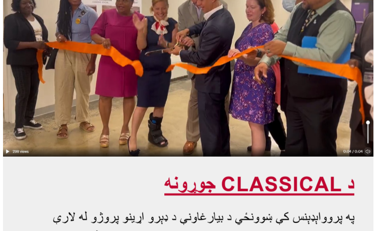
د بیک دالی ورکول

د ټولني او درناوي کلتور رامنځته کول داسې ډول سره د تعلیمي حوزې د جوړولو کلیدي ده چې زموږ زده کوونکي کولای شي بهر ویاړ شي او د رینټونې تجربې تېره اوښي، د ټولې تعلیمي حوزې کارکوونکو له ټولو تمخالیونو څخه ولاړل ترڅو ښوونځي ته د راستنېدو لپاره زده کوونکو او کورنیو ته په سبک کې ښه راغلاست ووايي! پدغه جشنونو کې نوک او هوونګي کورونه، ژوندی موسیقي، د ایسکریم لاری، د اور وژنې لاری او ډیر نور شامل وو.