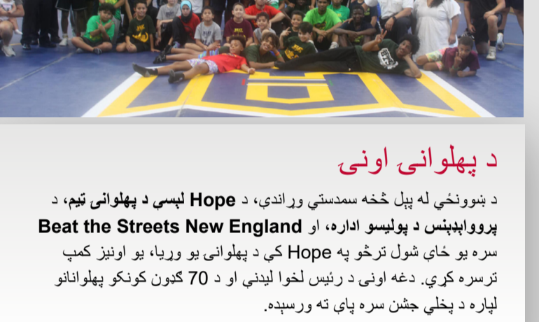
د پهلوانی اونۍ

د Vartan Gregorian لومړنی ښوونځی زده کوونکو د دوښنې په ورځ د ښوونځي لومړني ورځ یوه ډېره په زړه پورې ورځ درلوده، د براون پوهنتون د ورزشکاره زده کوونکو له تود هرکلي څخه مننه! تاسو هر یوه څخه مننه چې دغه ځوانو زده کوونکو سره مو د کال په سم پیلولو کې د مرستې لپاره وخت وخت وکړئ.