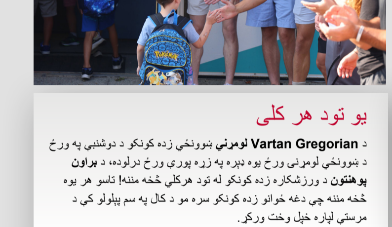
یو تود هر کلی

د Vartan Gregorian لومړنی ښوونځی زده کوونکو د دوښنې په ورځ د ښوونځي لومړني ورځ یوه ډېره په زړه پورې ورځ درلوده، د براون پوهنتون د ورزشکاره زده کوونکو له تود هرکلي څخه مننه! تاسو هر یوه څخه مننه چې دغه ځوانو زده کوونکو سره مو د کال په سم پیلولو کې د مرستې لپاره وخت وخت وکړئ.