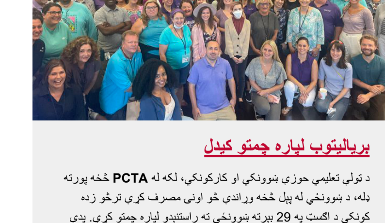
بریلیټوب لپاره جمنو کیدل

په پرووایډنس کې ښوونځي د بیلغولونې د ډېرو اړینو پروژو له لارې عصري کېږي. پدې اونۍ کې په Classical لیسې کې د څو کلني پروژې د لاندې په څو ځایونو کې نوي برانډ ټیګونه وویشي. که چېرې تاسو د تېرې وینډۍ د نوي ورځو کې کومه پېښه له لاسه ورکړې وي، اندېښنه مه کړئ. ښوونځي ته د بیک دالی ورکول به لاس ته راوړي، نو د خپل ښوونځي دفتر سره وګورئ ترڅو وګورئ چې، آیا تاسو کوم یو ترلاسه کولای شئ که نه.