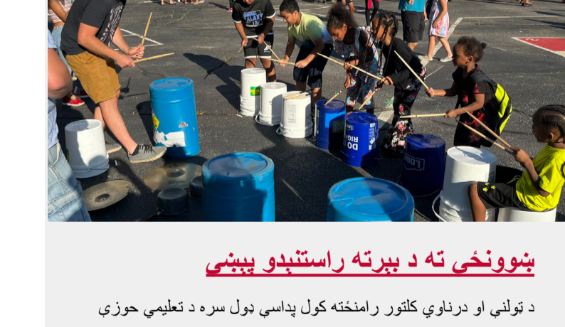
ښوونځي ته د بېرته راستنېدو پېښې

د ټولني او درناوي کلتور رامنځته کول داسې ډول سره د تعلیمي حوزې د جوړولو کلیدي ده چې زموږ زده کوونکي کولای شي بهر ویاړ شي او د رینټونې تجربې تېره اوښي، د ټولې تعلیمي حوزې کارکوونکو له ټولو تمخالیونو څخه ولاړل ترڅو ښوونځي ته د راستنېدو لپاره زده کوونکو او کورنیو ته په سبک کې ښه راغلاست ووايي! پدغه جشنونو کې نوک او هوونګي کورونه، ژوندی موسیقي، د ایسکریم لاری، د اور وژنې لاری او ډیر نور شامل وو.