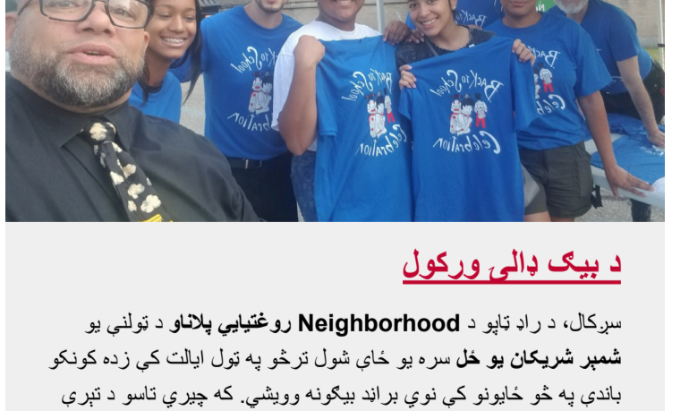
د بیک دالی ورکول

د ټولې تعلیمي حوزې ښوونکي او کارکوونکي، لکه له PCTA څخه پورته ډله، د ښوونځي له پیل څخه وړاندې څو اونۍ مصرف کړې ترڅو زده کوونکي د اګسټ په 29 بېرته ښوونځي ته راستنېدو لپاره جمنو کړي. پدې کې شاملو ساتنه پرمختګ او د ښوونځي پیل لپاره د ټولګیو جمنو کول شامل وو. ستاسو د ټولو له هلو ځلو څخه مننه!