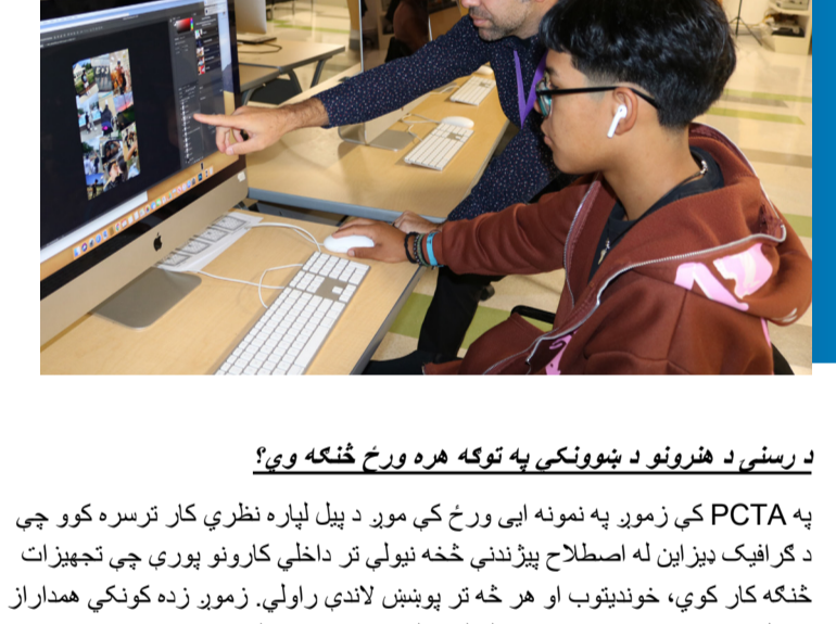
د رسنۍ د هنرونو د ښوونکي په توګه هره ورځ څنګه وي؟

په PCTA کې زموږ په نمونه ابي ورځ کې موږ د پیل لپاره نظري کار ترسره کوي چې د ګرافیک ډیزاین له اصطلاح پېژندنې څخه نیولې تر داخلي کارونو پورې چې تجویزات څنګه کار کوي، ځانګړتیاوې او هر څه تر پوښتنې لاندې راولي. زموږ زده کوونکي همداراز د خپل Adobe تصدیق ترلاسه کولو لپاره له روزنیزو ماڼیولو سره خورا ډېر کوښښ او مطالعه کوي چې هغوی د هغو سخت ویر د کارولو په اړه ژورې زده کړې ترسره کوي. د ورځې دویمې نیمې برخه هغه وخت دی کله چې موږ هغه څه چې هغوی زده کړي دي په عملي تجربې تطبیق کړو. نو له همدې امله، کله چې تاسو زموږ په لابراتوار کې وګرځئ تاسو نښي زموږ ماشومان وګورئ چې په کمپیوټر کې د ډیزاینګ وګورئ، زیر پیراني د ټوټوڅې یوسلمه پریس کوي، او خپل ډیزاینونه ژوند ته راوړي. موږ د ټولنیزو سټوډیو او داسې فضا هم لرو چېرې چې زده کوونکي پوښتنو ته لیدل او خپل تولیدات چې ژوندی بڼه څېروي، د یادې بڼې باندې یو نظر په ولیکي او بیا یې ډیجیټل نړۍ ته راوړي یا خپل خلاقیت په زیر پیراني کې وړاندې کړي!